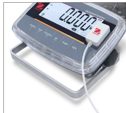
Kit RS232 IR en option pour le modèle i-D61PW